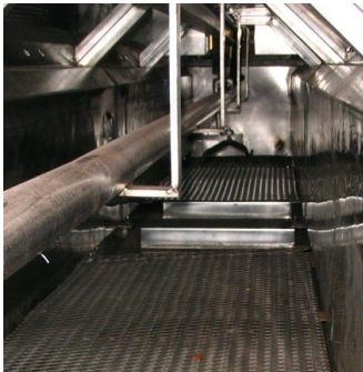
Protection des composantes ultrasoniques