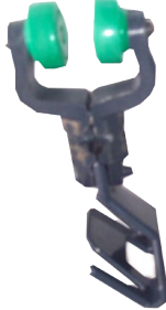
Crochets secteur volaille