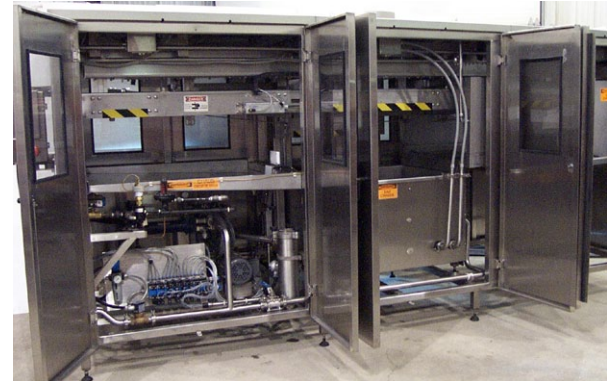
Mécanique facile d'accès et d'entretien