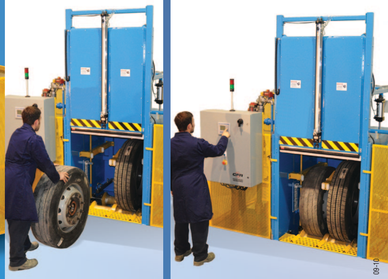
Équipement d'opération ergonomique demandant peu d'effort physique de la part des opérateurs