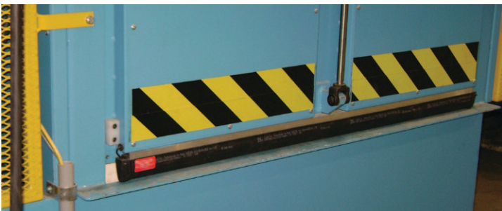
Composantes de sécurité rendant l'opération simple et sécuritaire