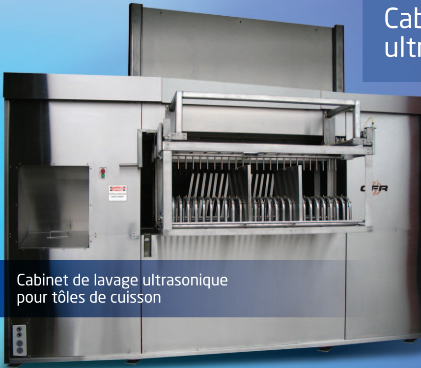
Cabinet de lavage ultrasonique pour tôles de cuisson