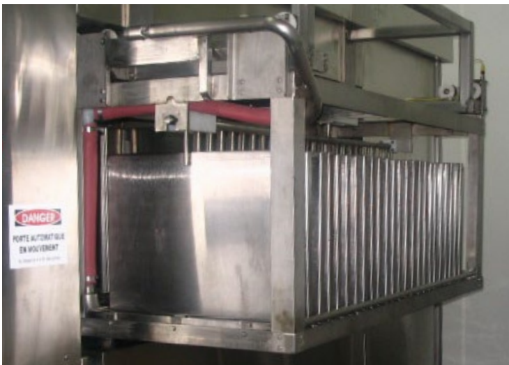
Chariots adaptés à la quantité de tôles lavées