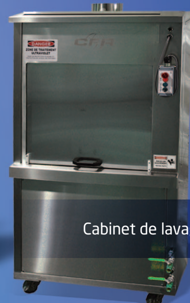
Cabinet de lavage «Nomad»